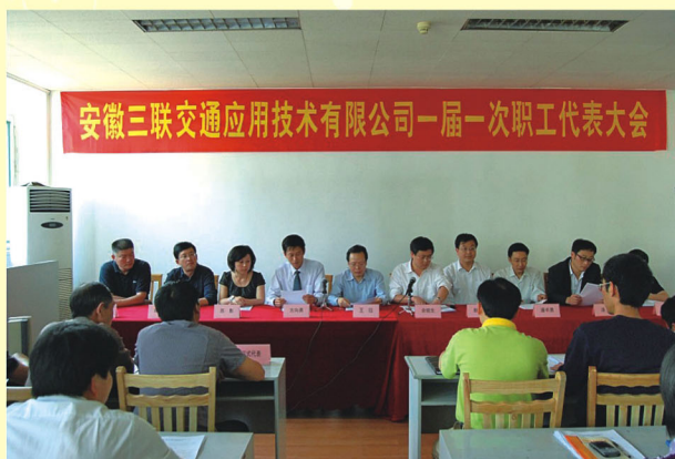
交通应用公司召开一届一次职工代表大会