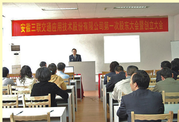
交通应用股份公司召开创立大会暨第一次股东大会